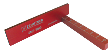
Marking-wedge Gauge Markierungs-Prüfkeil