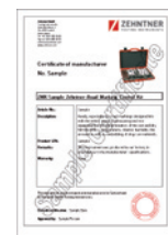
Certificate of manufacturer Hersteller-Zertifikat