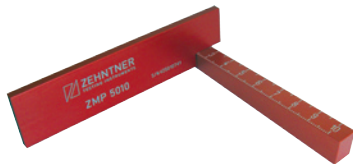
Marking-wedge Gauge Markierungs-Prüfkeil