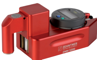
Digital Marking Gauge Digitaler Markierungsmesser