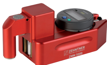
Digital Marking Gauge Digitaler Markierungsmesser