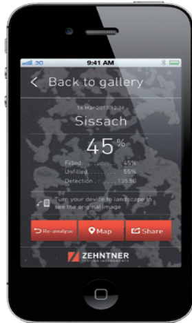
Result of an analysis of surface coverage Ergebnis einer Flächenbedeckungsanalyse