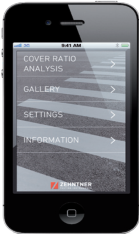
Main menu of Zehntner App Hauptmenü des Zehntner App