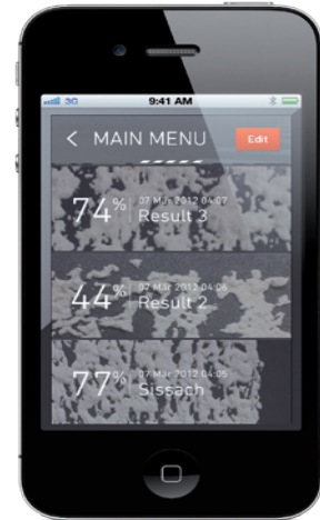
Zehntner App gallery Zehntner App-Galerie

Алматы (7273)495-231 Ангарск (3955)60-70-58 Архангельск (8182)63-90-72 Астрахань (8512)99-46-04 Барнаул (3852)73-04-60 Белгород (4722)40-23-64 Благовещенск (4162)22-76-07 Брянск (4832)59-03-52 Владивосток (423)249-28-31 Владикавказ (8672)28-90-48 Владимир (4922)49-43-18 Волгоград (844)278-03-48 Вологда (8172)26-41-59 Воронеж (473)204-51-73 Екатеринбург (343)384-55-89